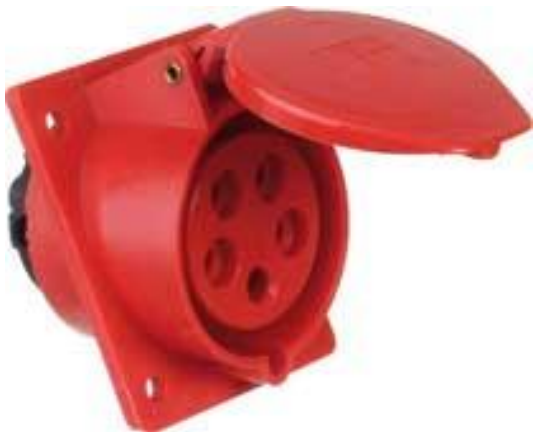
1 x PRISE TRIPHASE 32 Ampères 380 V type P17 (rouge) 3 Phases + Neutre + Terre