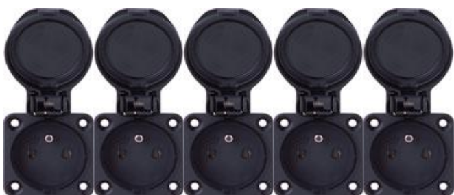
6 x PRISES COURANT 16 Ampères 220 V Phase + Neutre + Terre